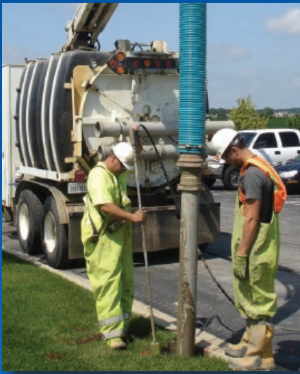
Manguera Amphibian de PVC con interior de Poliuretano, altamente flexible para succión y descarga de productos abrasivos. Uso rudo con resistencia a la abrasión, al agua y al aceite.