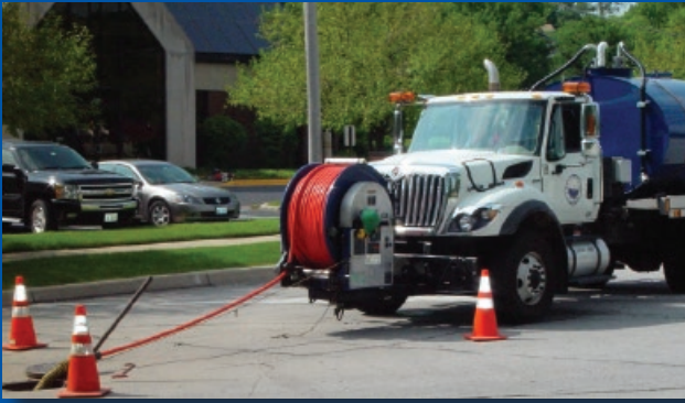
Manguera termoplástica de alta presión para limpieza de drenajes.