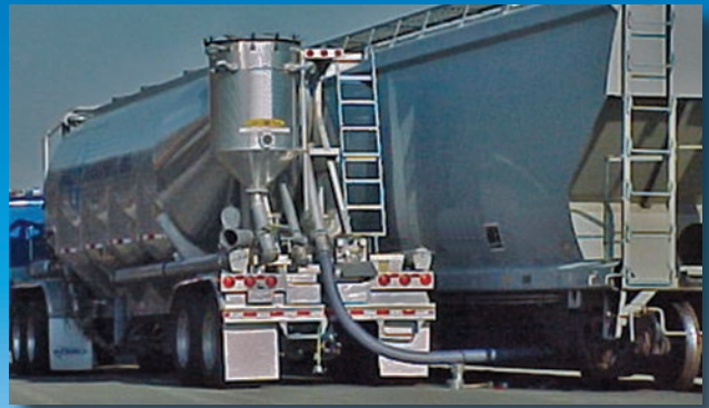
Manguera metálica para descarga de materiales a granel desde tolvas.