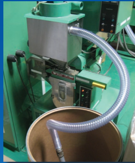
Mangueras de PVC Series WE/WT con y sin alambre antiestático para la transferencia mediante sistemas neumáticos de pellet y otros materiales secos granulados.