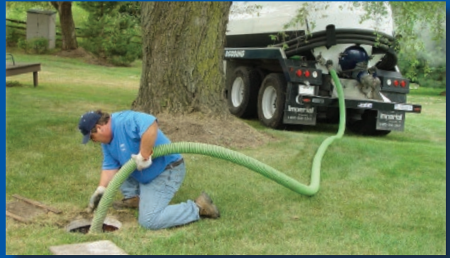
Mangueras de EPDM para limpieza de fosas sépticas. La original Tiger Green (verde) y las nuevas series Tiger Yellow (amarilla), Tiger Blue (azul) y Tiger Red (rojo).